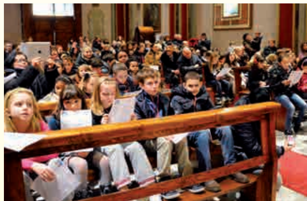
L'arrivo dei Magi nella Chiesa di S. Cristiana...