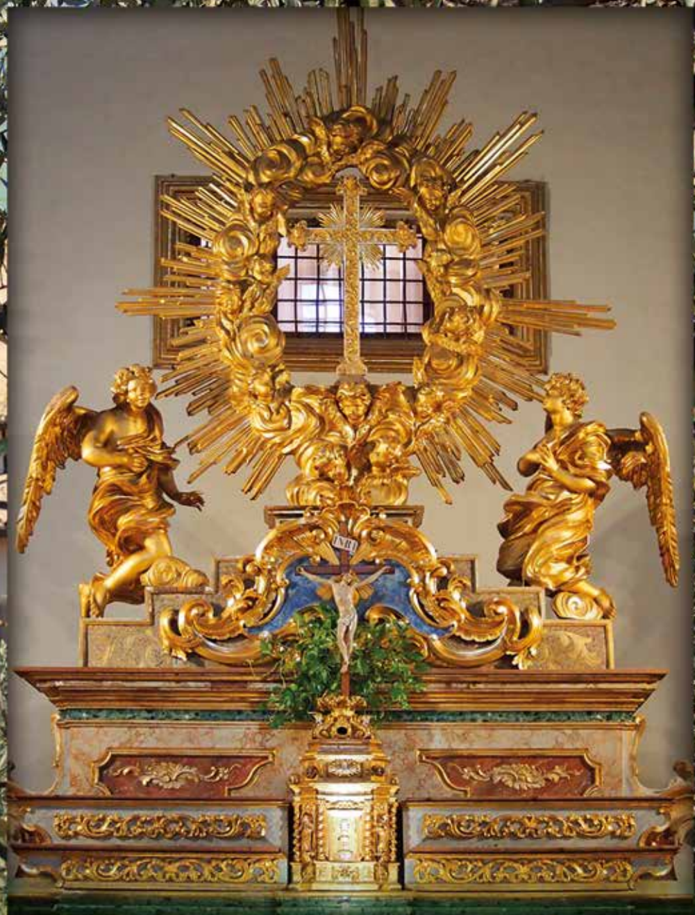
S. CHIARA DELLA CROCE da Montefalco - agostiniana