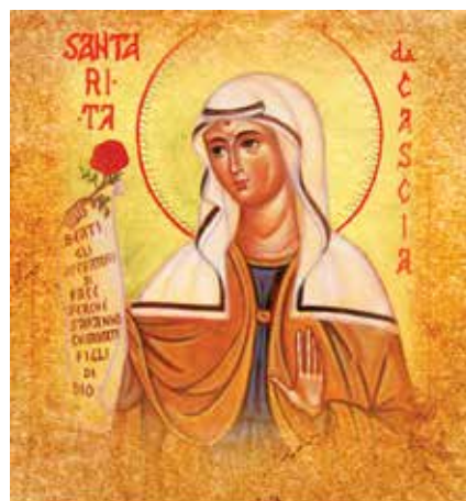
cod. B 05