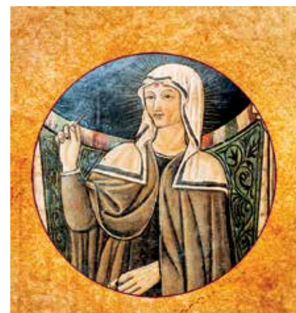
cod. B 06