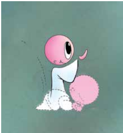
cod. B 10 Giovani