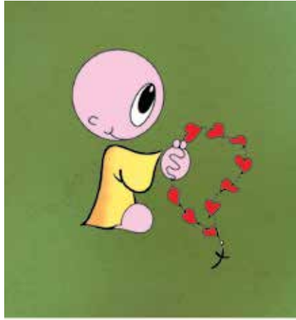
cod. B 08 Giovani