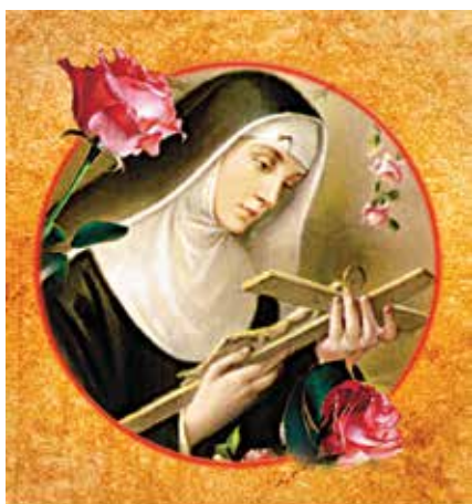
cod. B 04